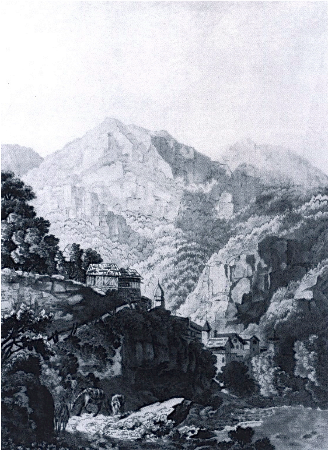
Thusis von Süden. Aquatinta von A. Benz und J. J. L. Billwiller, um 1795 (Rätisches Museum)