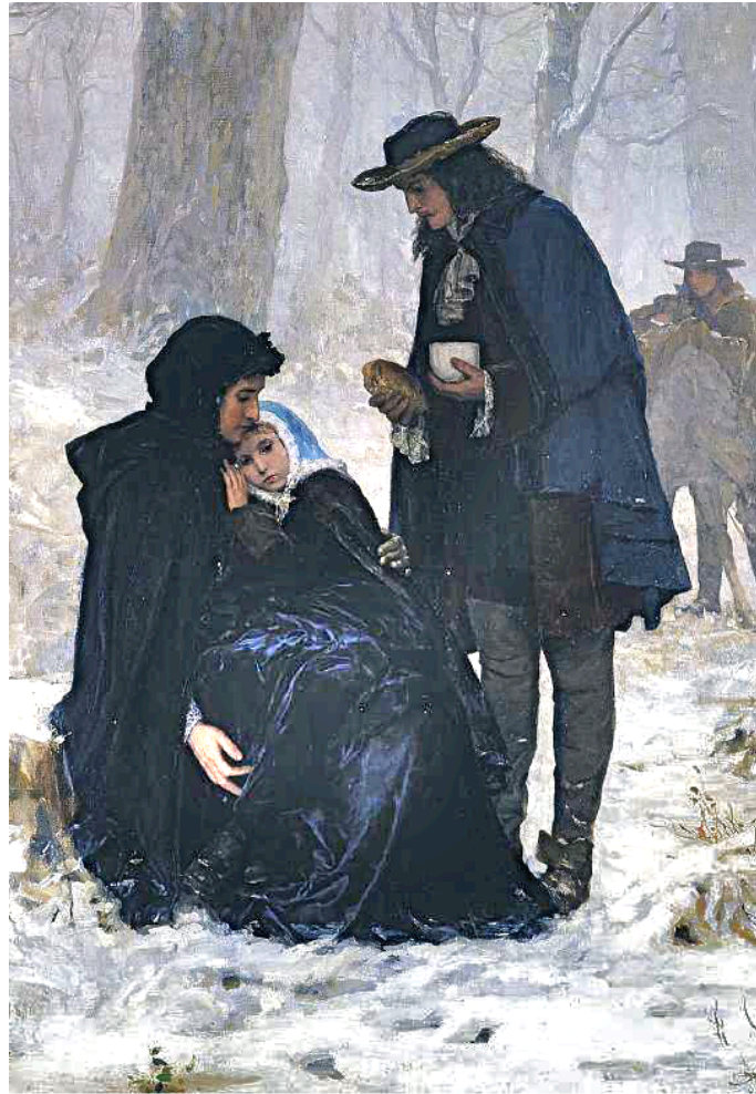
«Protestantische Flüchtlinge». Ölgemälde von Albert Anker, 1885

So kam es zum «zweiten Refuge» (nach dem «ersten Refuge» der französischen Glaubensflüchtlinge im 16. Jahrhundert). In der grössten Massenauswanderung des frühneuzeitlichen Europa emigrierten etwa 160'000 Hugenotten aus Frankreich: 20'000 in die reformierten Orte der Eidgenossenschaft, 40'000 in protestantische Territorien des Deutschen Reichs, 50'000 in die Niederlande, 40'000 nach Grossbritannien. Etliche Refugianten fanden auch in den skandinavischen Ländern, in Russland, in Nordamerika sowie in Südafrika eine Zuflucht und neue Heimat.